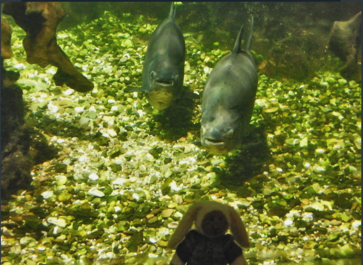
ERNST AUF TAUCHSTATION